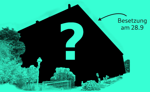
Besetzung am 28.9